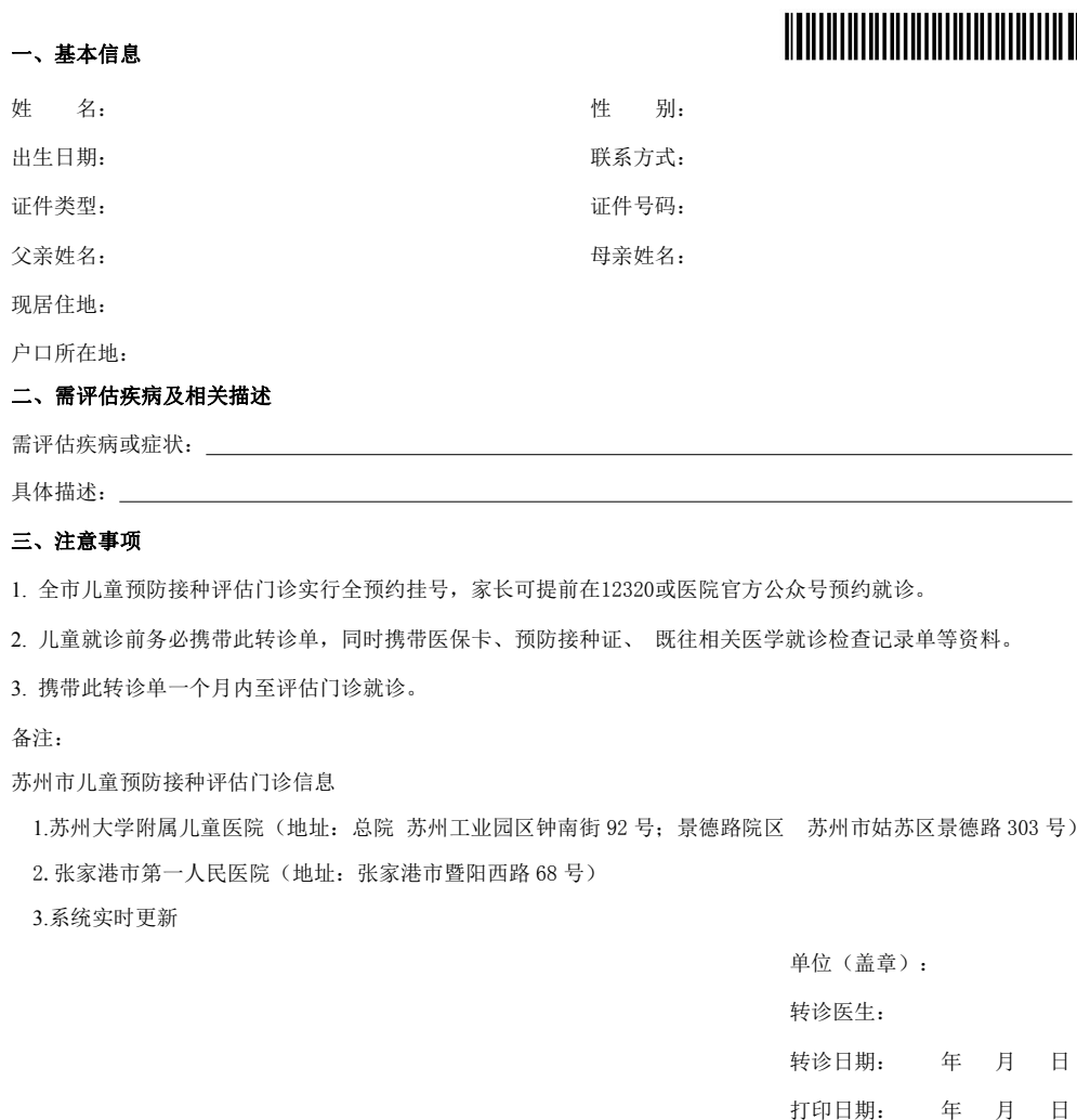
表 C.1 儿童预防接种评估转诊单